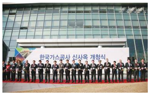
▲한국가스공사개청식(2014. 11. 27)