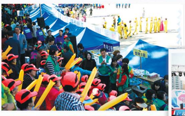
▲ 제35회 경로체육대회