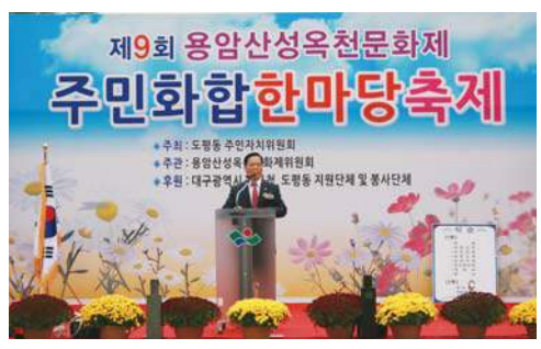
▲제9회 용남산성옥천문화제 주민화합한마당축제(2014.10.12)