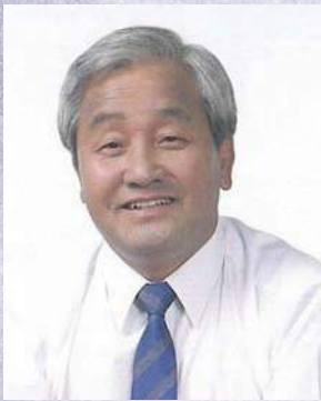
• 신중하 의원 •