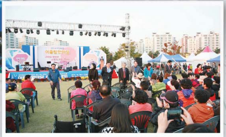
▲ 2014 구민화합 어울림한마당