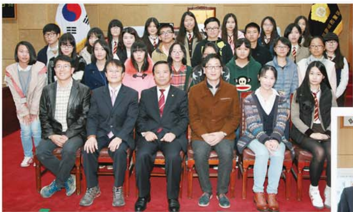
▲ 중국 소주시 오중구 국제학습교류단 동구의회 방문