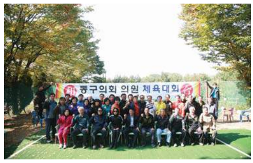
▲의회 및 집행부 친선체육대회(2014. 11. 03)