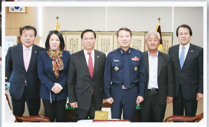
▲ K2 군수사령관 의장실 방문