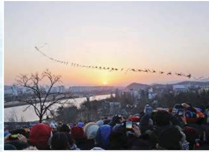
2015을미년 해맞이 행사