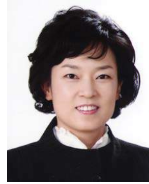
발언자 : 이재숙 의원

안녕하십니까? 해안동, 안심 1동, 2동 지역구 이재숙 의원입니다. 안심동은 율하 택지지역의 신도시화로 인한 급속한 인구증가와 항공기 소음 피해 보상 및 안심연료단지 주변 주민건강 영향조사 등에 따른 복합적인 민원 증가, 그리고 저소득층 밀집지역 소재 및 복지급여 수혜대상자의 다양화로 사회복지 직원의 증원과 민원인 편의시설 확충 그리고 민원업무 담당직원들의 최소한의 사무실 공간 확보가 시급한 현실입니다. 그 동안 여러 가지 방법을 강구해서 환경개선을 추진하였으나 현실적인 어려움이 많았습니다. 가장 큰 문제는 현 청사의 안전등급이 최저등급으로 신축 외에는 별다른 방법이 없다는 것입니다. 따라서 장기적인 관점에서 주민센터 도로를 관련부서와 협의하여 용도폐지 후 대지로 지목변경하고, 공원 일부를 구 도시계획위원회의 심의를 거친 후 대지로 변경하여 건물 신축안을 건의하기로 했습니다. 동구의 열악한 재정상황을 봤을 때 결코 쉽지 않은 문제이지만, 최소한의 행정업무공간 확보와 열악한 주민 편의시설 개선 차원에서 주민센터 신축이 우선시되어야 할 문제라 생각하며 모두가 관심을 가지시고 안심동 주민센터 신축에 협조해 주실 것을 제안드립니다.