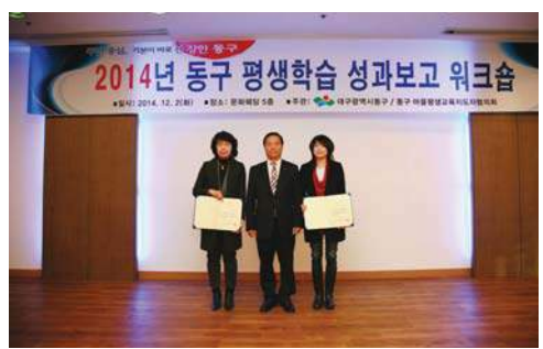
▲2014 동구평생학습 성과보고 워크숍(2014. 12. 02)