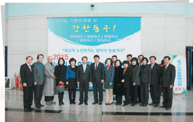
▲ 2015 노인사회활동지원 사업 발대식(2015. 03. 09)