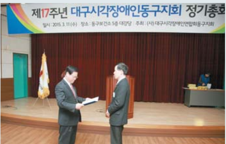
▲제17주년 대구시각장애인동구지회 정기총회 (3월 11일)