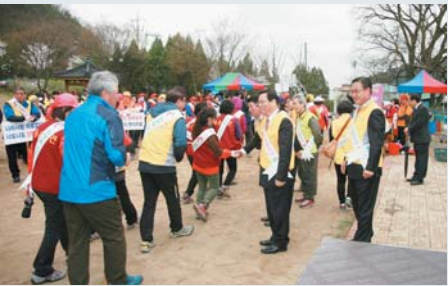
▲2015 산불방지 캠페인 (4월 1일)