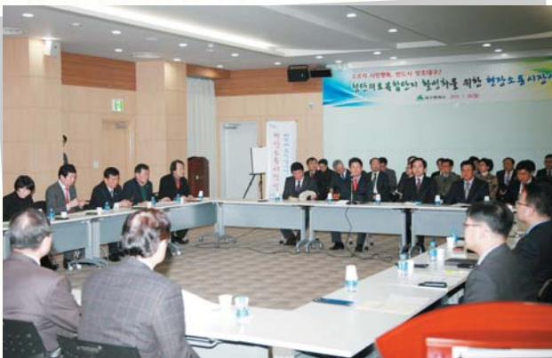
▲ 첨단의료복합단지 민생소통을 위한 열린 시장실 참석 (2015. 01. 26)