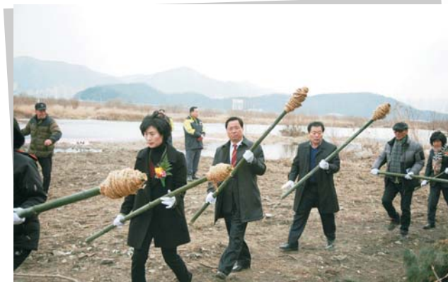
▲ 정월대보름 달집태우기 행사 (2015. 03. 05)