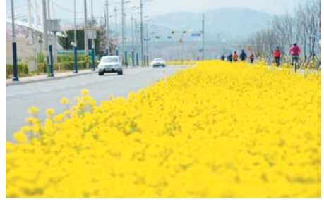
표지설명_ 울하지역 금호강변 노란 유채꽃밭길

DONG-GU COUNCIL NEWS, 2015 April. Vol. 47