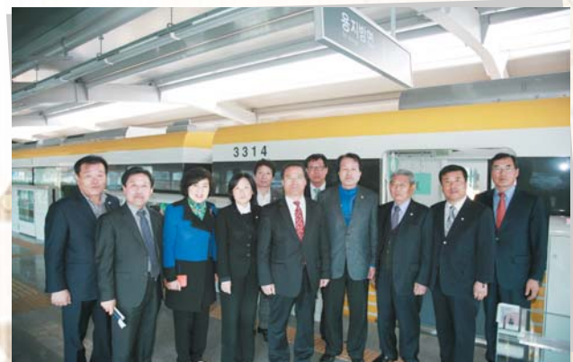
▲ 도시철도 3호선 시승 (2015. 03. 24)