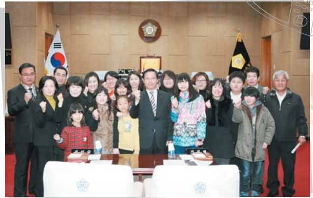
▲ 송정초등학교 동구의회 방문 (2015. 01. 22)