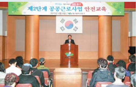
▲제2단계 공공근로사업 안전교육 (4월 6일)