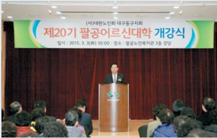
▲제20기 팔공어르신대학 개강식 (3월 3일)